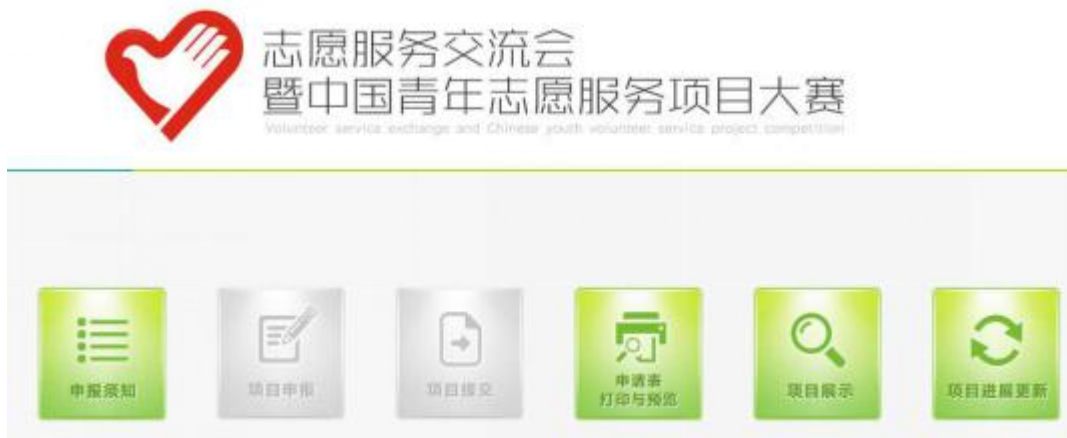
图 22 项目提交完成后主界面样式